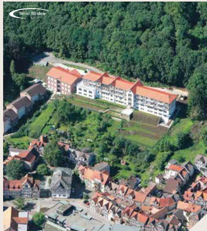
DIPLOMA Hochschule, Bad Sooden-Allendorf

Ein Unternehmen der Bernd-Blindow-Gruppe