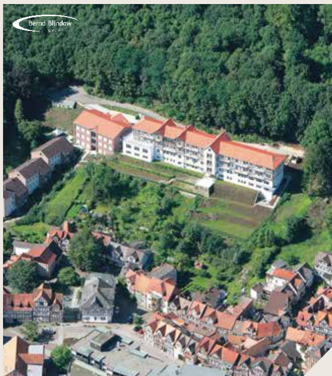
DIPLOMA Hochschule, Bad Sooden-Allendorf

Ein Unternehmen der Bernd-Blindow-Gruppe